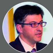
安德里亚·加维内利， 欧盟委员会动物福利、 抗微生物药物耐药性处负责人

“中国是欧盟的重要合作伙伴，我们欢迎 Eurogroup for Animals提交的报告。其中阐述的一套重要的多项参与方式，可供欧盟健康与食品安全总司和所有相关的其他总司进行选择。这份文件有助于今后更好地聚焦和协调。”