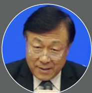
于康震， 农业农村部副部长， 2017年

“我们不仅将加快动物福利立法进程，适当增补和修订现行法律法规的有关规定，同时还要推动制定促进动物福利的综合性新法规。”